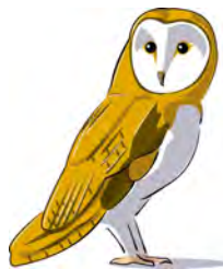
La chouette effraie

- L'arbre têtard (charme, saule, frêne etc), les arbres fruitiers haute tige (tronc de + de 2 m) et les arbres morts forment en vieillissant des cavités, privilégiées pour les chouettes chevêches.