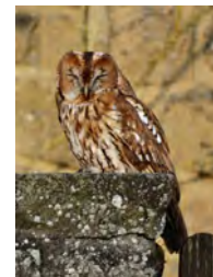
La chouette hulotte

- Les clochers d'églises, s'ils sont ouverts et les granges, quand elles ne sont pas obstruées, permettent à la chouette effraie de s'y reproduire et y élever ses petits, car ce sont des lieux tranquilles et proches des territoires de chasse.