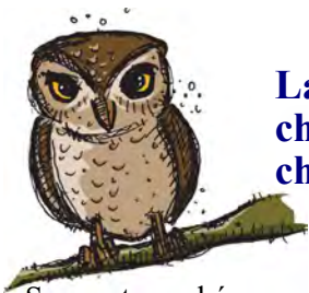
La chouette chevêche

Les chouettes et les hiboux sont des rapaces nocturnes qui sont souvent confondus. Malgré les ressemblances frappantes, il ne s'agit en aucun cas des mêmes espèces, les chouettes ne sont pas les femelles des hiboux. La différence entre ces deux groupes d'oiseaux repose uniquement sur la présence visuelle "d'aigrettes" : des petites plumes en forme de cornes que seuls les hiboux possèdent.